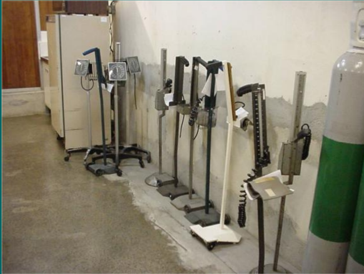
Zavariz C. São Paulo, 2009