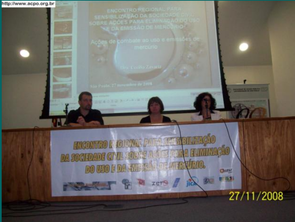
Auditório da Faculdade de Saúde Pública da USP -FSPUSP Zavariz C. São Paulo, 2009