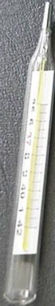
Termometro de mercúrio